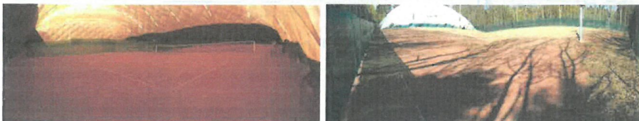
(jobb képből illesztett panorámafotók)